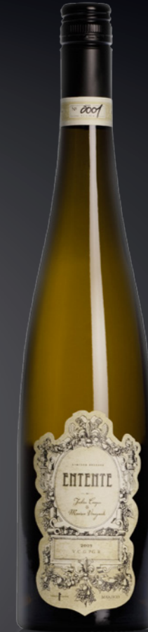
BVS Flûte Altus