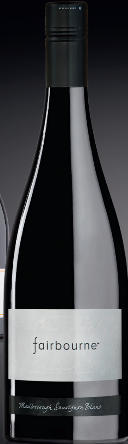
BVS Bourgogne Atlas