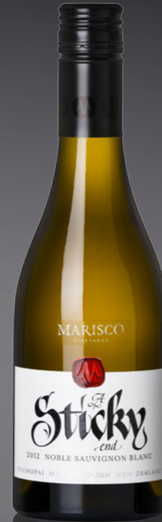
BVS Bourgogne Prestige