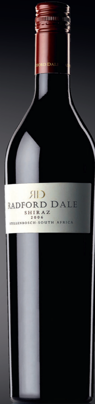
BVS Bordelaise Byblös