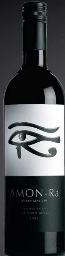
BVS Bordelaise Saint-Pierre