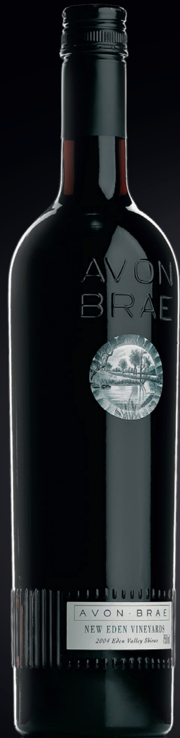
BVS Bordelaise Première