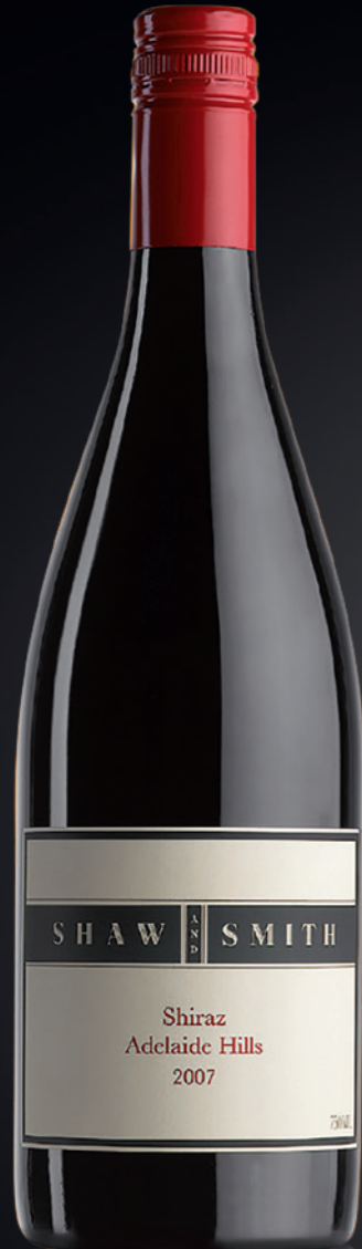
BVS Bourgogne Chardonnay