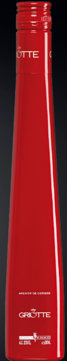
BVS Flûte Allegro