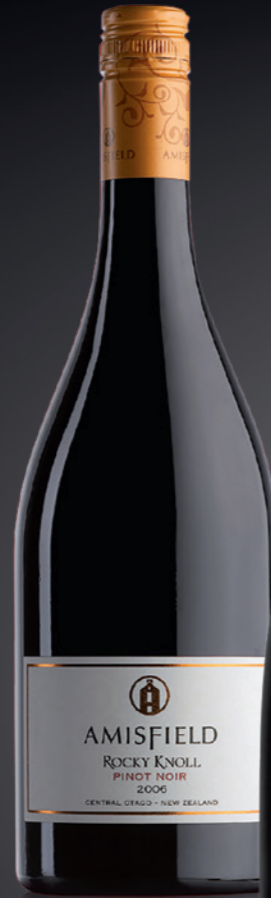
BVS Bourgogne La Baronne