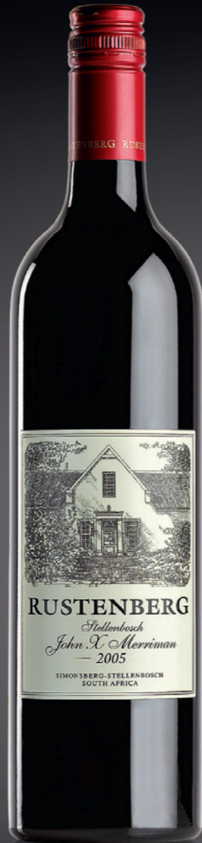
BVS Classic Bordelaise